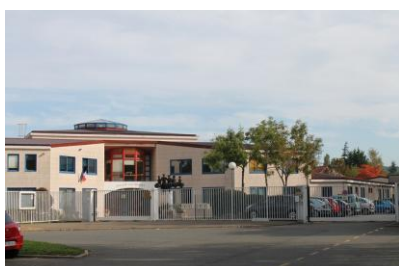
Collège Jean Monnet