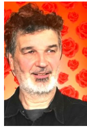
PAGES du PILOU

Ich verwirre gerne den Betrachter mit meinen grob in Holz gehauenen Personen oder Tieren. Das Totem erzählt eine fiktive Geschichte.