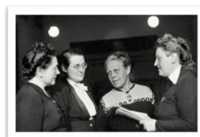
"Müttern des GG"