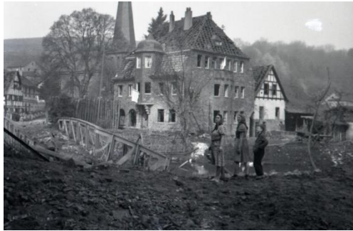
Foto: Volberger Brücke