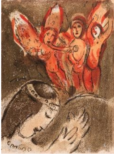
© VG Bild-Kunst 2017, Chagall, Sarah und Engel.

Wo: Bildungswerkstatt an Schloss Eulenbroich, Zum Eulenbroicher Auel 15, Rösrath