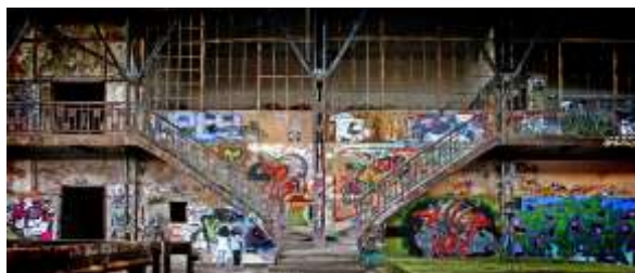
„Vergessene Orte“ Thorsten Tho Kropp 1. Publikumspreis 2015